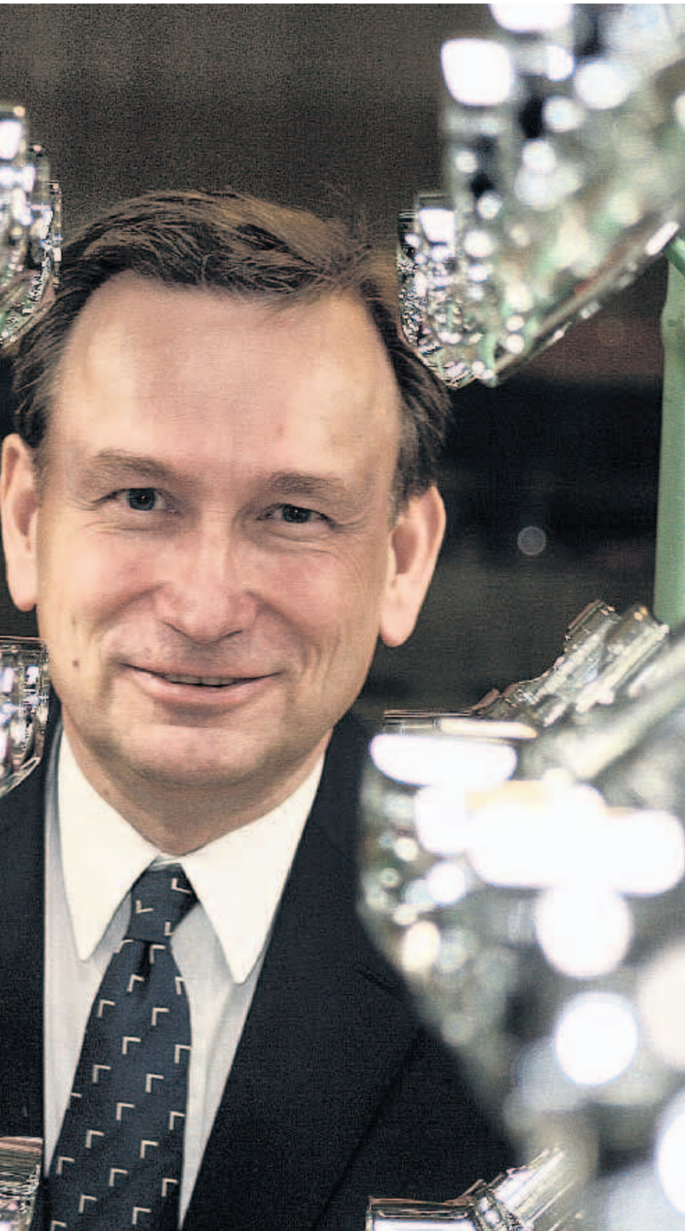
FM Mattsson och Mora Armatur.